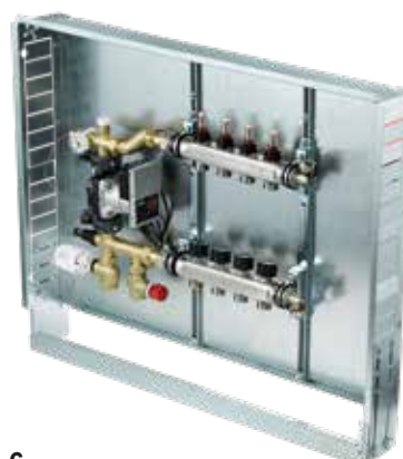
Variante 6 Vertikal mit Pumpengruppe PUSH-23 Verteilerbalken mit Pumpen-Beimischgruppe PUSH-23, mit Festwertregelset, Anschluss 3/4", vertikal