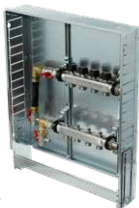
Variante 3 Vertikal mit WMZ Verteilerbalken mit Wärmemengenzähler- Anschlussset 3/4", Anschluss vertikal