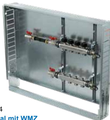
Variante 4 Horizontal mit WMZ Verteilerbalken mit Wärmemengenzähler- Anschlussset 3/4", Anschluss horizontal