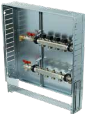
Variante 1 Vertikal ohne WMZ Verteilerbalken mit Kugelhahn 3/4", Anschluss vertikal