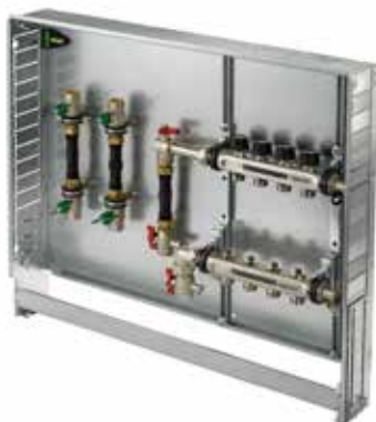
Variante 5 Vertikal mit WMZ und Wasserzähler-Passstück Die Passstücke für Kalt- und Warmwasserzähler sind in der Verteilerstation integriert und für den Einbau aller marktüblichen Zähler geeignet