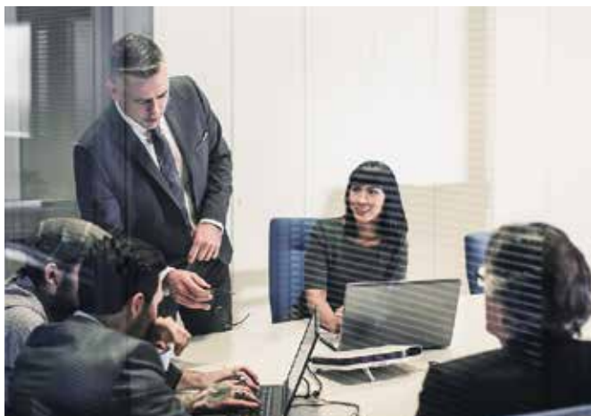
Besprechungsräume, Lichthöfe, Kantinen und Einzelbüros – alle haben unterschiedliche Anforderungen an die Temperatur

Smatrix Base Pro stellt durch den automatischen hydraulischen Abgleich für jeden einzelnen Raum die exakt benötigte Energiemenge für die Einhaltung der gewünschten Temperatur zur Verfügung – unabhängig von äußeren Einflüssen.