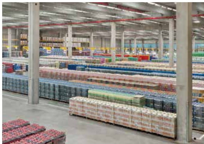
Uponor Smatrix PRO sorgt für eine komfortable Temperaturregelung in Gebäuden unterschiedlichster Größe