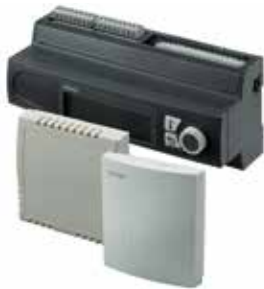
Vorlauftemperaturregelung Uponor Smatrix Move PRO