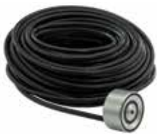
Schnee- und Eisfreihaltung