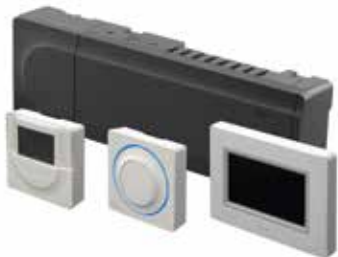
Multiraum-Steuerungssystem Uponor Smatrix Base PRO

Einfache Installation, Einrichtung und Bedienung – ein Kontakt für alle Bereiche