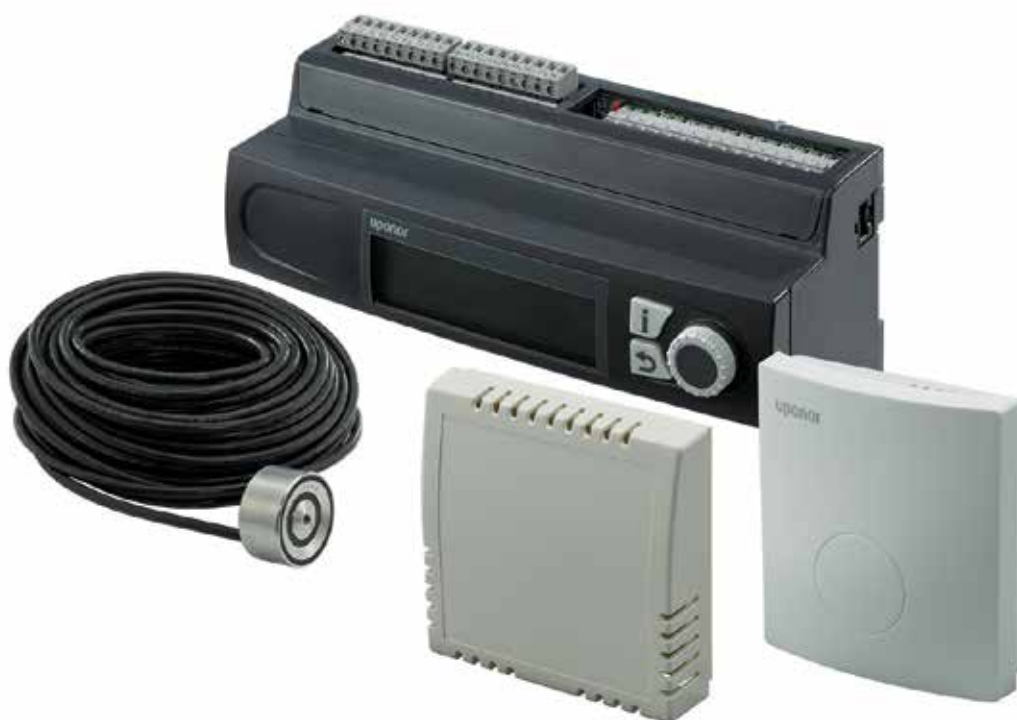
Uponor Smatrix Move PRO zur Steuerung von Flächentemperatur zur Schnee- und Eisfreihaltung

Uponor Smatrix Move PRO ist die Ergänzung zu Smatrix Base PRO, mit der eine neue Dimension moderner Temperaturregelungstechnik erreicht wird. Sie ermöglicht das Heizen und Kühlen durch eine Multizonen-Wasserversorgung und aktiviert bei Frost durch spezielle Sensoren die Schnee- und Eisfreihaltung im Außenbereich. Die Komponenten von Uponor Smatrix Move PRO lassen sich in bestehende KNX Gebäudemanagementsysteme integrieren.